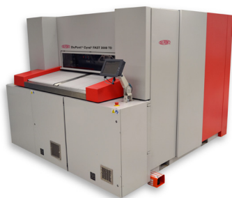
DuPont™ Cyrel® FAST 3000 TD