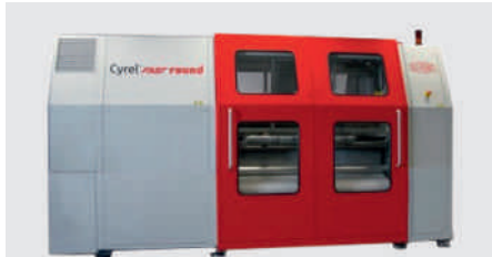
DuPont™ Cyrel® FAST round FR 1450